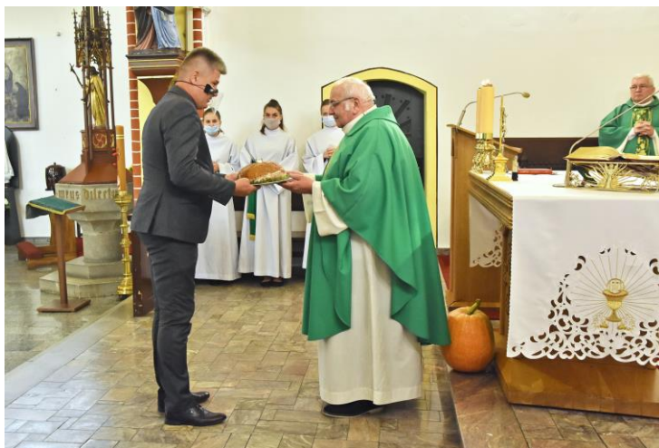
Przekazanie chleba dożynkowego