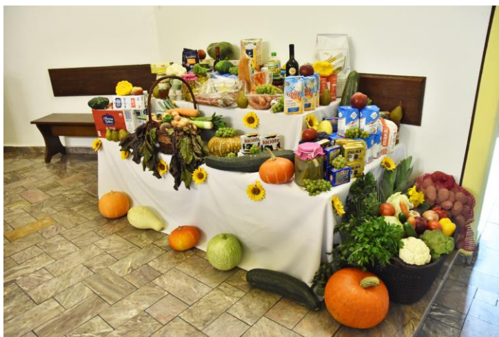
Stół z darami dożynkowymi